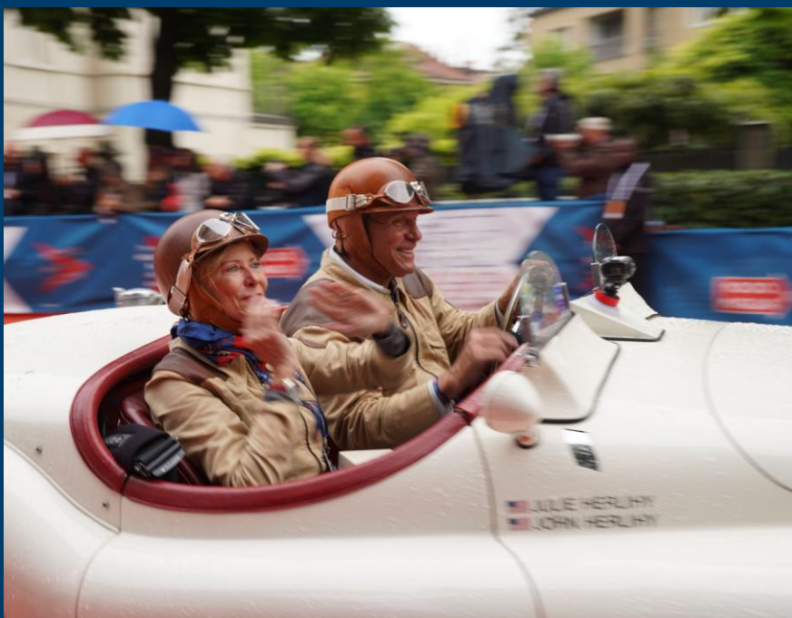
Herlihy/Herlihy il miglior equipaggio U.S. della 1000 Miglia 2019

Un evento ideato per partecipanti esperti e principianti